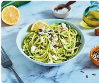
SPAGHETTIS DE LEGUMES*